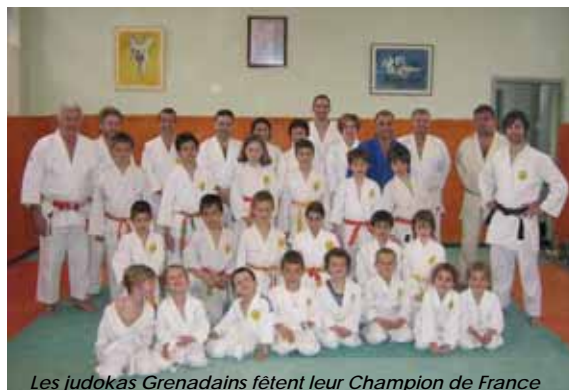
Les judokas Grenadains fêtent leur Champion de France

http://www.judo-club-grenade.blogspot.com/