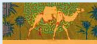
Causerie-Concert La musique d'Orient Pierre Blanchut le 9 juin 2009