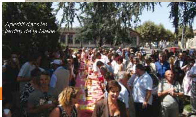
Apéritif dans les jardins de la Mairie