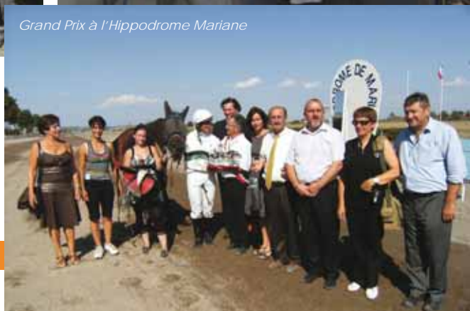
Grand Prix à l'Hippodrome Mariane