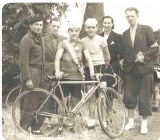
Victoires du père et du fils Championnat des Pyrénées, 1942

Mais avant ça, "Jojo" fut Champion des Pyrénées en 1942, aux côtés de son père. Tous deux franchirent la ligne d'arrivée en tête, ce qui reste un souvenir