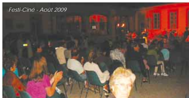
Festi-Ciné - Août 2009

Retrouvez l'ensemble de notre programmation sur notre répondeur au 05 61 82 44 85 ou sur notre site : www.grenadecinema.fr