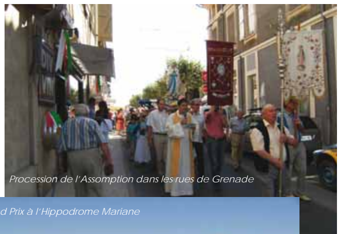
Procession de l'Assomption dans les rues de Grenade