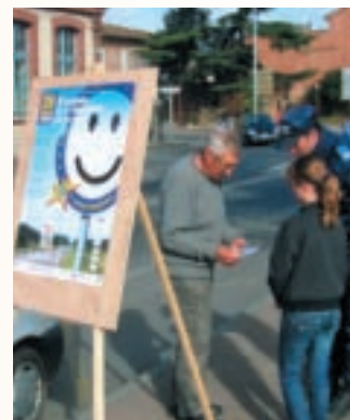
Un automobiliste récompensé par un autocollant et une charte de bonne conduite.