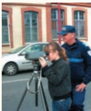
Contrôle « aux jumelles » devant la Mairie