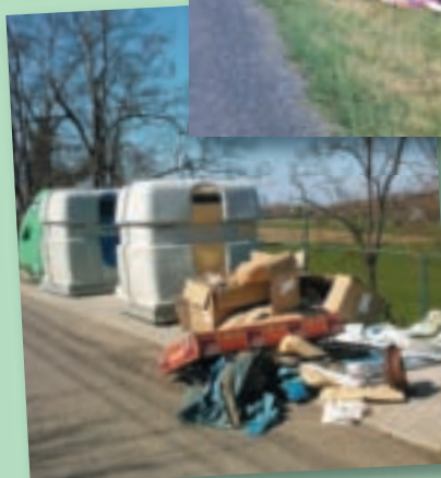
Chemin de Fontaine – Mars 2009

De nombreux moyens pour le traitement des déchets sont à la disposition de la population (ramassage des ordures ménagères, zones de tri sélectif, déchetterie, ramassage des encombrements etc...) pour éviter de tels actes.