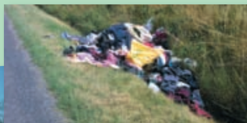
Route de Saint Cézert – Juillet 2008