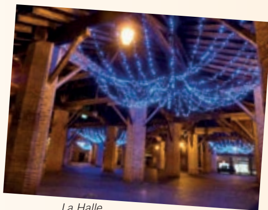
La Halle dans son habit de lumières...

Nous vous rappelons que les colis repas sont distribués par les Restos du Cœur tous les lundis de 13 h à 15 h 30, au siège, rue de Belfort, à Grenade.