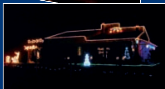
Les maisons de Grenade illuminées : la magie de Noël...