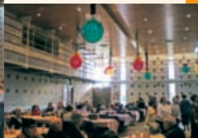
Samedi 20 décembre: "Les Acolytes de Marguerite", spectacle offert par l'Association des Commerçants.