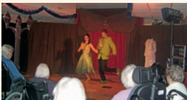
Spectacle du jeudi 18 décembre "L'Art en Scène"