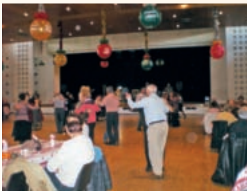
Thé dansant offert par la Municipalité; Après-midi du mercredi 3 décembre.